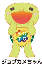
ジョブカメちゃん